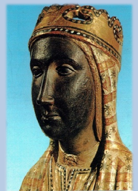
Mare de Déu de Montserrat Patrona de Catalunya

O Déu, Vós que concediu tots els béns, i que gloriïeu amb un culte insigne la muntanya escollida per l'excelsa Mare del vostre Fill únic. Feu que, ajudats amb la poderosa protecció de la immaculada sempre verge Maria, puguem arribar amb seguretat a la muntanya, que és Crist. Pel mateix Crist, Senyor nostre. Amén.